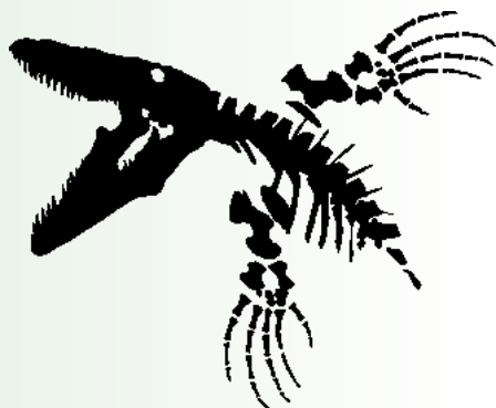
Auf Wunsch des Meistspenders hat das Tier den Namen „Regina“ (Königin) erhalten.

Allen Spendern sei für ihre Großzügigkeit herzlich gedankt. (FdNHMW)