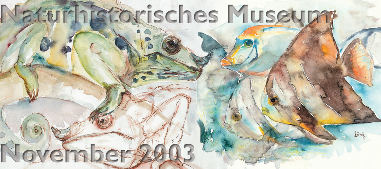
Titelbild: Chamäleon und Tropische Fische ; Margit König Bild Rückseite: Eulen im Winter ; Gerda Winkler-Born