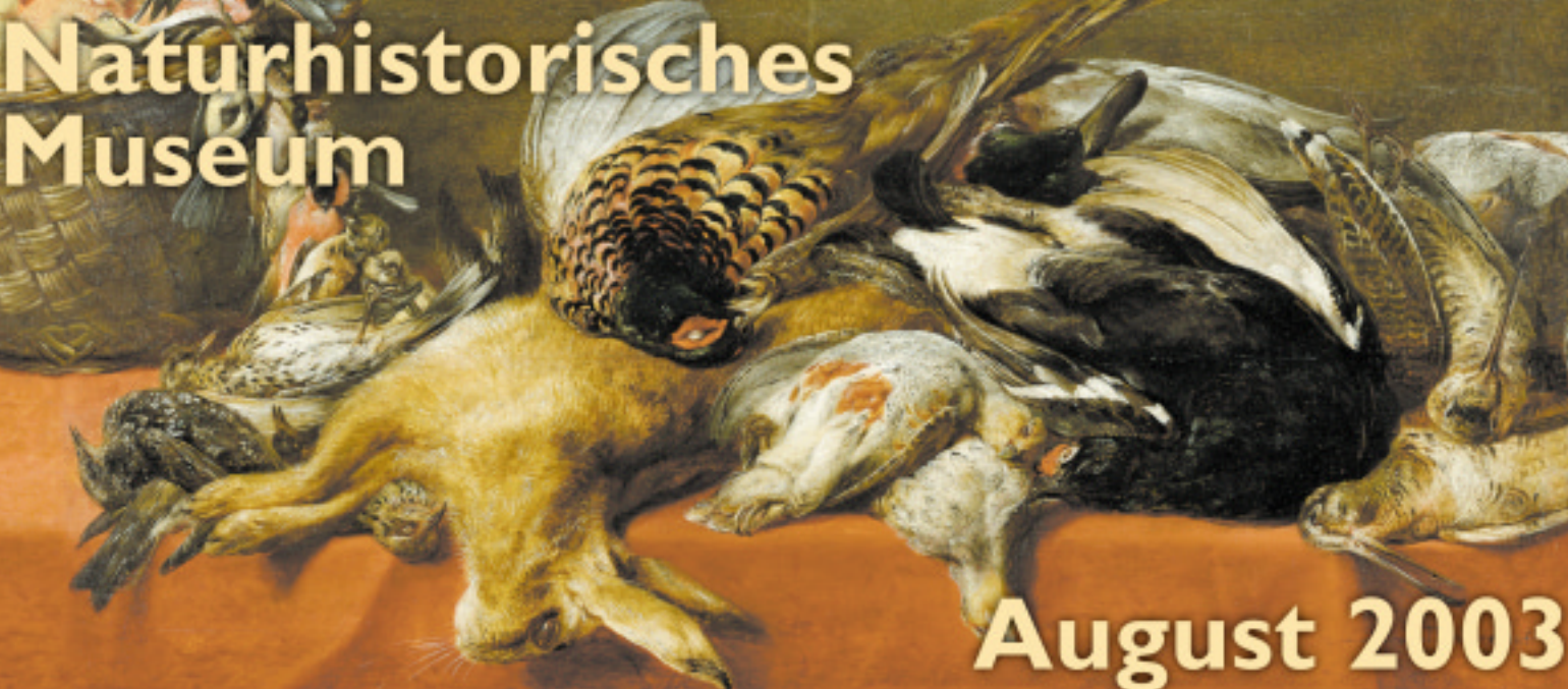
Titelbild: Frans SNYDERS „Jagdstillleben“ (Ausschnitt, KHM Inv.No. 9695, ca. 1650)