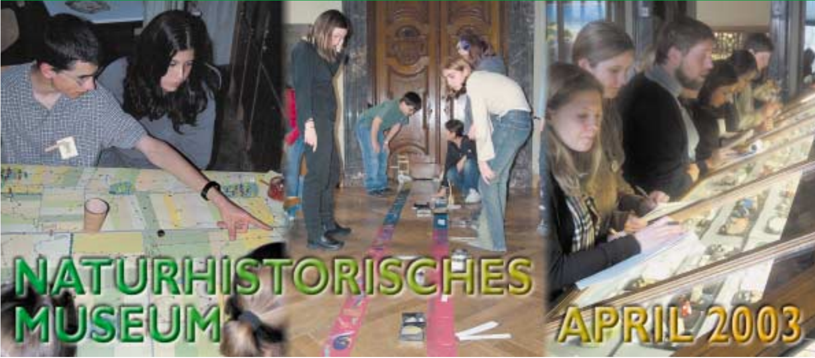
Titelbild: Angebote der MP am NHM