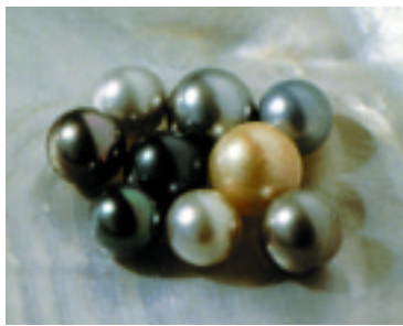
Südsee-Kulturperlen aus Tahiti: die Farbpalette reicht von grau bis tiefschwarz, den Farbnuancen sind keine Grenzen gesetzt.

Der internationale Schmuckwettbewerb „Tahitian Pearl Trophy“ wird heuer bereits zum zweiten Mal organisiert. Insgesamt nehmen 37 Länder daran teil, 10 Schmuckkategorien, in denen Kulturperlen aus Tahiti verarbeitet wurden, stehen zur Wahl. Die Präsentation der österreichischen Designer, Künstler, Goldschmiede und Juweliere findet wieder im NHMW statt.