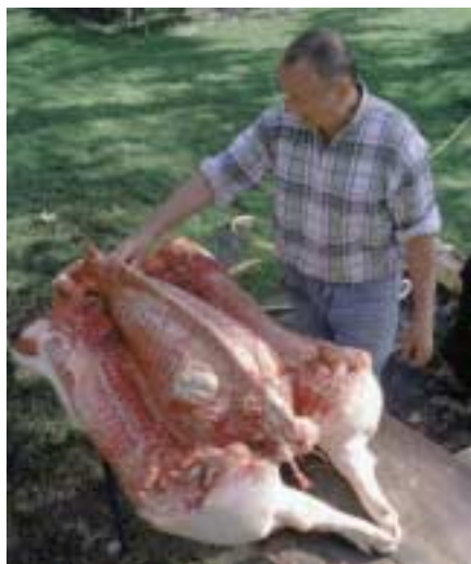
„Ausschülen“ des Stützskeletts und der Innereien

In den meisten anderen prähistorischen Siedlungen überwiegen dagegen Rinderknochen. Doch selbst innerhalb der Schweineknochen herrschte ein auffälliges Ungleichgewicht zwischen den einzelnen Skelettabschnitten. Oberschädel, Wirbel und Rippen fehlten fast ganz, dafür gab es reichlich Unterkiefer und Gliedmaßenknochen. Vor allem die besten Schlachtagersklassen waren vertreten, und darin wieder nur Eber, kaum Sauen. Um die restlichen Tierarten stand es nicht viel anders.