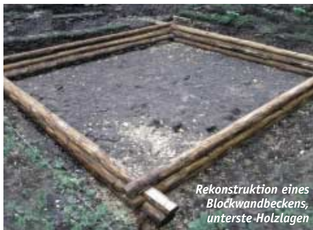
Rekonstruktion eines Blockwandbeckens, unterste Holzlagen