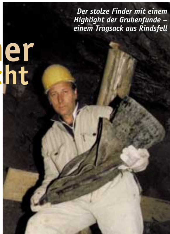
Der stolze Finder mit einem Highlight der Grubenfunde – einem Tragsack aus Rindsfell

Schon bald war klar, daß die Schwierigkeiten und Kosten bergmännischer archäologischer Forschungsarbeit nur den Weg der kleinen Schritte erlaubten. Diese führten nicht immer zielstrebig in die gleiche Richtung, sondern mancher Wechselschritt ergab sich. So bin ich im Laufe der Jahre „nebenbei“ zu einem ganz passablen Tänzer geworden. Näher auf alle Unternehmungen einzugehen, würde den Rahmen dieses Beitrages sprengen, doch sollen einige kurz angesprochen werden: 100 m Grabungsstollen im Kilbwerk, der Fundstelle des legen-