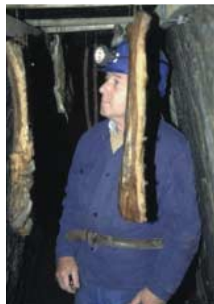
Reifung des salzkonservierten Fleisches im Bergwerk