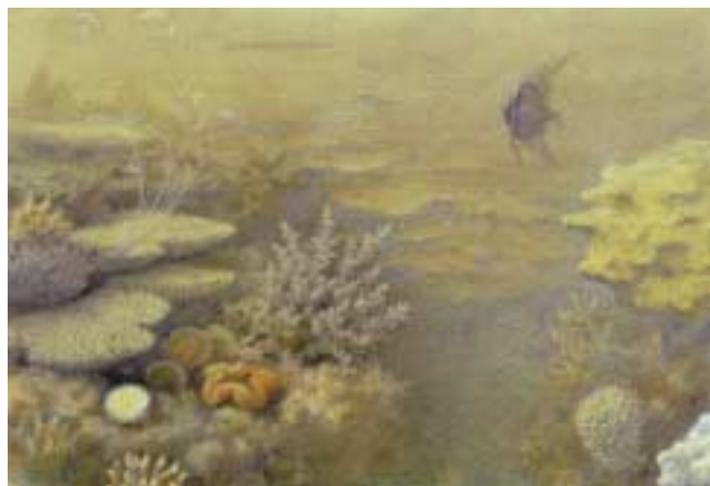
„Korallenbank von Tor nächst der Hafeneinfahrt“, E. v. Ransonnnet

Im Jänner 1862 brach er zu einer Reise in den Orient auf. Im März besuchte er Tor, eine kleine Hafenstadt am Golf von Suez, auf der Halbinsel Sinai. Seinem großen Wissens- und Tatendrang folgend, wollte er die Fauna des Roten Meeres vor Ort kennenlernen. In seinem Reisebericht, den er im darauffolgenden Jahr in Wien veröffentlichte, brachte er dem Leser die Schönheit der Welt unter Wasser in lebhaften und anschaulichen Schilderungen nahe.