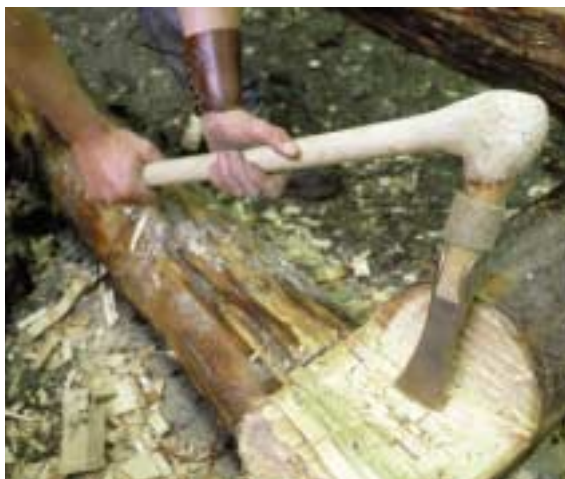
Holzbearbeitung mit rekonstruiertem Lappenbeil

Nach der jüngsten Theorie werden die Blockwandbauten als Surbecken gedeutet, die zum Einsalzen großer Fleischmengen verwendet wurden. Die eingetieften Blockwandbassins (aus dem 12. Jahrhundert vor Christus) und die Schweineknochen hängen vermutlich mit einer frühen fleischverarbeitenden „Industrie“ im Salzbergtal zusammen. Es scheint, daß man früher das Fleisch zum Salz brachte und nicht – wie in all den Jahrhunderten danach – umgekehrt.