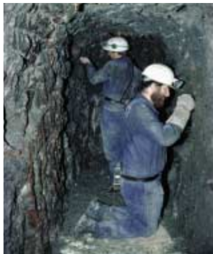
Archäologische „Feinarbeit“ in einem prähistorischen Stollen