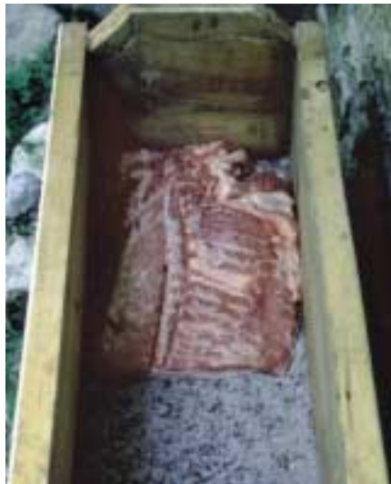
Einpökeln der Fleischteile in Bergsalz

Für eine solche Zusammensetzung des Knochenabfalls gibt es kaum Parallelen, am wenigsten aus der Urzeit. Damit stand die Forschung vor einem Rätsel. Den Weg zur Lösung weisen in aller Regel zunächst monatelange, mühsame Kleinarbeit und sorgfältige Analysen. Selbst geniale Ideen bleiben nutzlose Spekulationen, wenn sie nicht aus den Fakten selbst erwachsen. Manchmal können auch Ausschlußverfahren weiterhelfen. So kann in Hallstatt zunächst ausgeschlossen werden, daß die Tiere auf dem Salzberg selbst gezüchtet wurden. Dazu fehlt es nicht nur am nötigen Platz im engen Hochtal, sondern vor allem an Resten weiblicher und ganz junger Tiere, die im Abfall landwirtschaftlicher Produktionsstätten reichlich vorkommen. Es kann weiters ausgeschlossen werden, daß die Tiere vollständig auf den Salzberg gelangten, da zentrale Körperteile fehlen, die fleischreichen Gliedmaßenabschnitte aber reichlich vorliegen. Aus diesen beiden Prämissen kann wieder der Schluß gezogen werden, daß die Körper ohne die unnützen Teile auf den Salzberg gebracht und dort unter Verwendung des Salzes verarbeitet wurden.