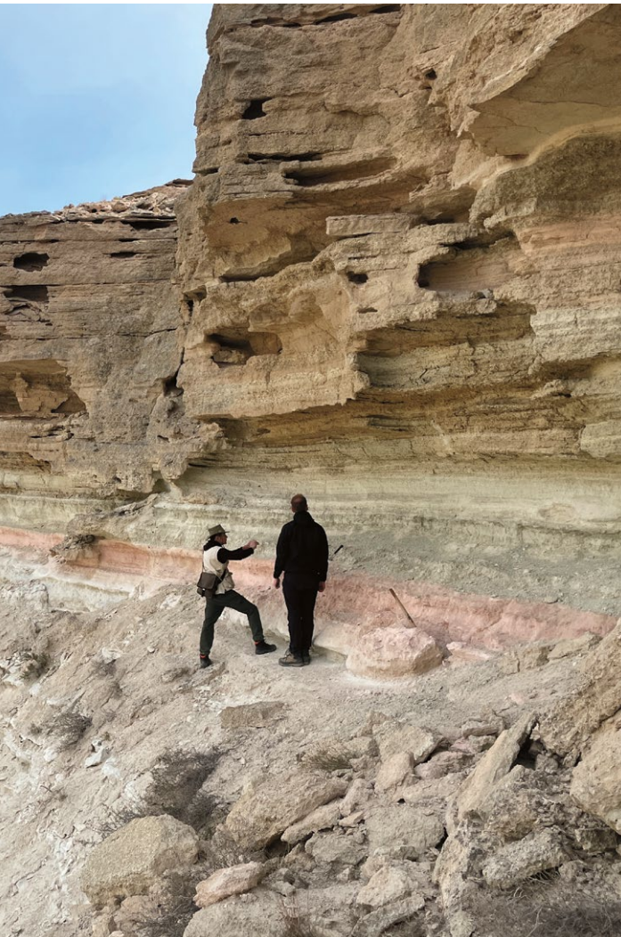
Reste eines fossilen Fisches bei Aqtau in Kasachstan