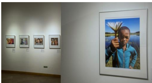
Ausstellungsansicht „PEACE. Die weltbesten Jugendfotos zum Thema Frieden“