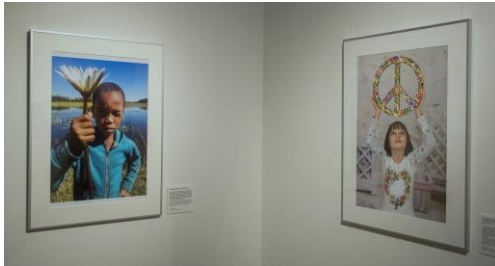
Ausstellungsansicht „PEACE. Die weltbesten Jugendfotos zum Thema Frieden“