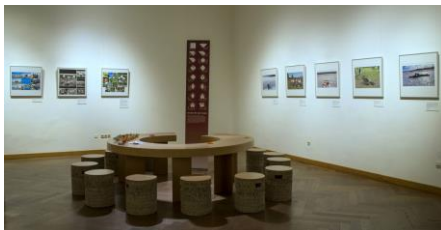
Ausstellungsansicht „PEACE. Die weltbesten Jugendfotos zum Thema Frieden“