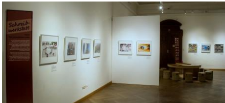
Ausstellungsansicht „PEACE. Die weltbesten Jugendfotos zum Thema Frieden“