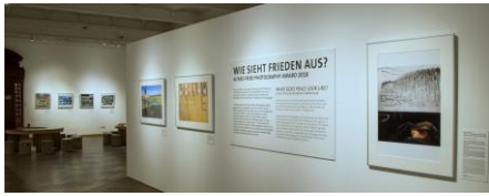
Ausstellungsansicht „PEACE. Die weltbesten Jugendfotos zum Thema Frieden“