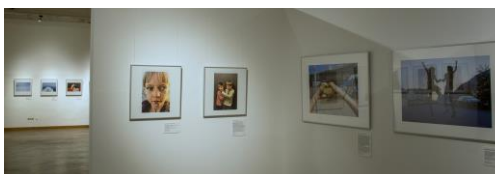
Ausstellungsansicht „PEACE. Die weltbesten Jugendfotos zum Thema Frieden“