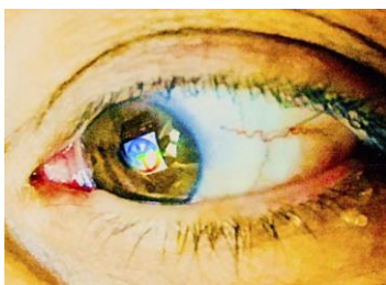
An eye on the peace