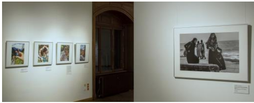
Ausstellungsansicht „PEACE. Die weltbesten Jugendfotos zum Thema Frieden“