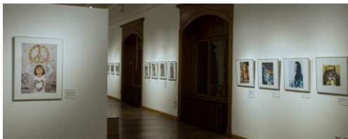
Ausstellungsansicht „PEACE. Die weltbesten Jugendfotos zum Thema Frieden“