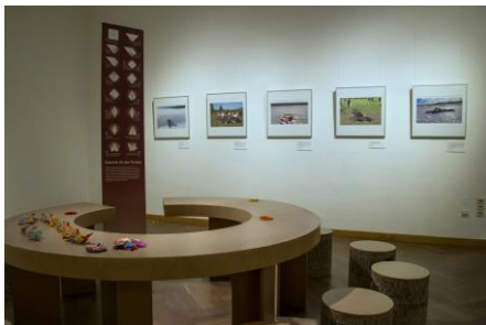
Ausstellungsansicht „PEACE. Die weltbesten Jugendfotos zum Thema Frieden“