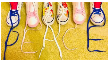
The colorful shoes of peace