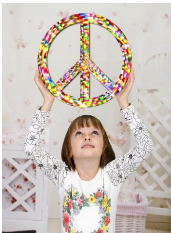
The peace on earth is in the hands of the children