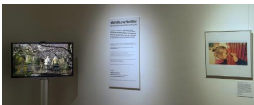
Ausstellungsansicht „PEACE. Die weltbesten Jugendfotos zum Thema Frieden“