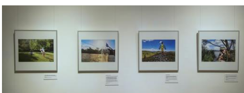
Ausstellungsansicht „PEACE. Die weltbesten Jugendfotos zum Thema Frieden“