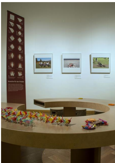
Ausstellungsansicht „PEACE. Die weltbesten Jugendfotos zum Thema Frieden“